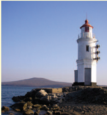
МАЯК ВО ВЛАДИВОСТОКЕ

море – преступление – маячник / маяк – погода –